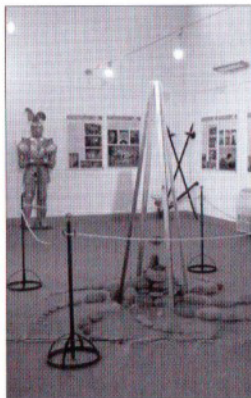
Le schede sono a cura di: Salvatore Ilardo, Salvatore Moncada, Silvana Schittino