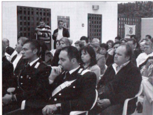
Nelle foto, alcuni momenti del convegno

Gli sforzi profusi da chi ha creduto ed investito tante energie, vogliono portare alla riscoperta di una identità storica "perduta", ed al contempo